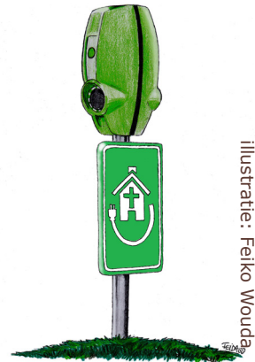
Illustratie: Felko Wouda