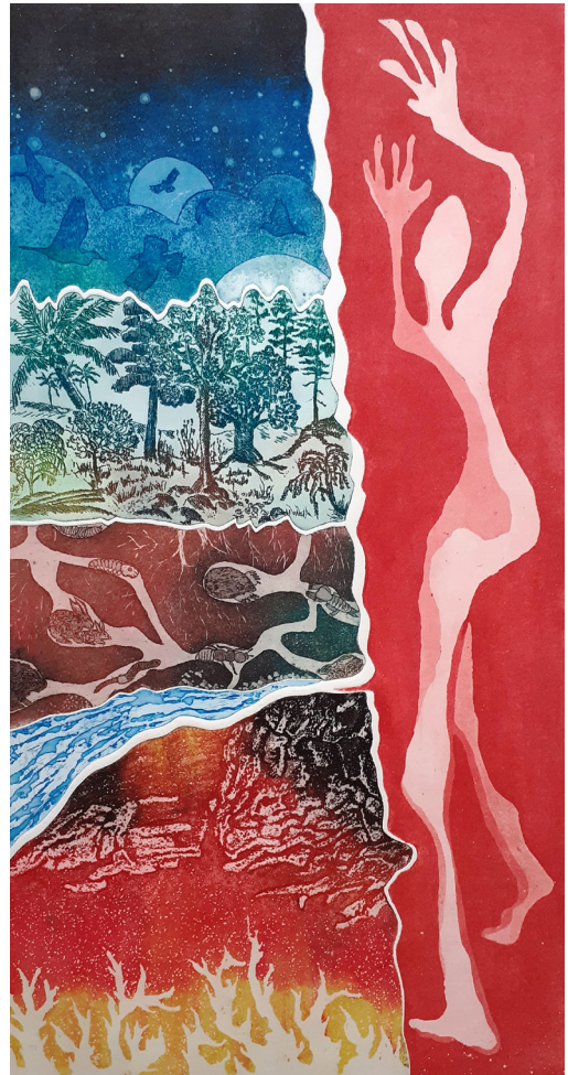
ets en foto: Thea Koot - 'aarde, mijn aarde'